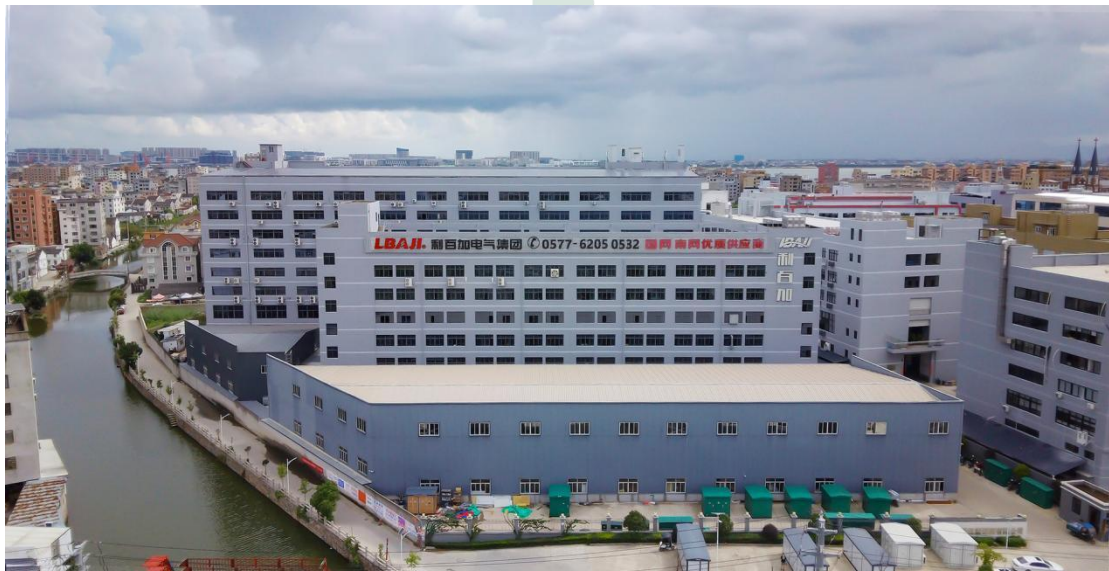
图 2.1.1 企业概貌

利百加电气集团有限公司是一家专业从事生产高低压电器元器件、仪表、高低压成套设备、配电开关控制设备、电力变压器、箱式变电站、电力电子元器件、自动化控制设备等电气设备全产业链，设计、研发、生产、销售于一体的现代化电气制造企业。