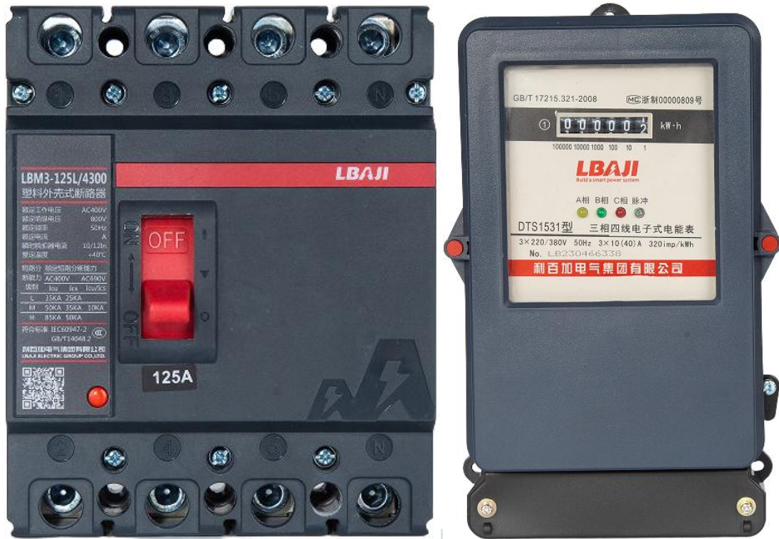
图 2.1.2 产品概貌