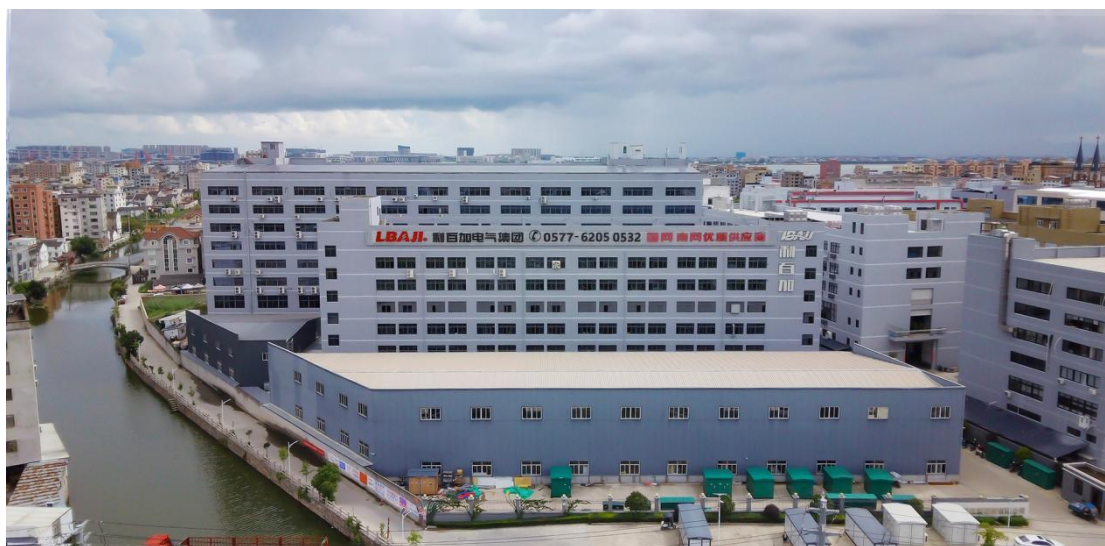
图 1 企业概貌

利百加电气集团有限公司是一家专业从事生产高低压电器元器件、仪表、高低压成套设备、配电开关控制设备、电力变压器、箱式变电站、电力电子元器件、自动化控制设备等电力设备全产业链，设计、研发、生产、销售于一体的现代化电气制造企业。